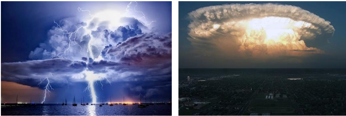
Figura 1.- Fotos de nubes Cumulonimbus.

Para la formación de una tormenta severa es necesario que se desarrollen las nubes conocidas como cumulonimbus o cumulonimbos. Éstas son densas y de considerable dimensión vertical, en forma de coliflor. Una parte de su región superior es generalmente lisa, fibrosa o estriada y casi siempre aplanada, la cual se extiende frecuentemente en forma de yunque o de vasto penacho. En la figura 1 se muestran nubes cumulonimbus típicas, la cual puede desarrollar una tormenta severa.