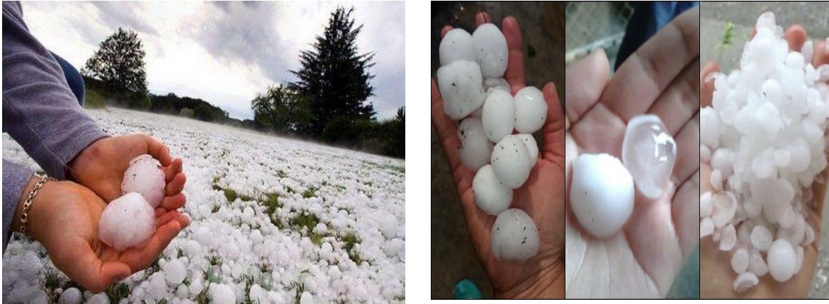
Figura 4. Fotos de granizo.

Es bueno comentar que en función de la cantidad y del tamaño del granizo, será la magnitud del posible daño.